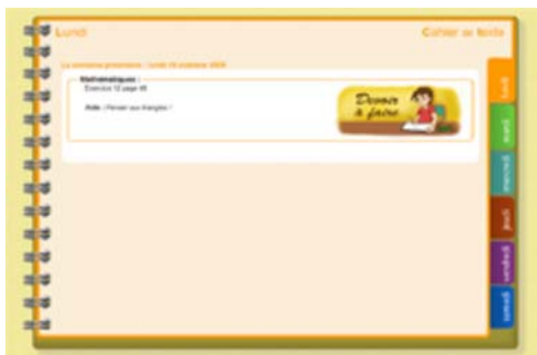
Le cahier de texte