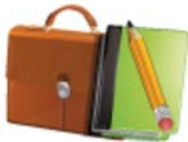
Icône représentant le cahier de texte